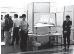
7月24日～27日・大田区役所本庁舎1階南側ロビー