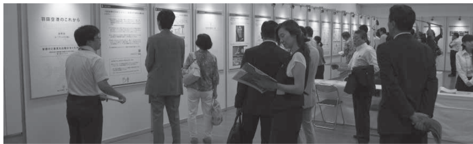
説明会の様子（7月21日～22日・タワーホール船堀 展示ホール2）

寄せられた意見については、意見の内容ごとに整理し、できるだけ積極的に発信し、幅広く共有する予定です。