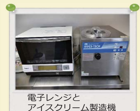
電子レンジと アイスクリーム製造機