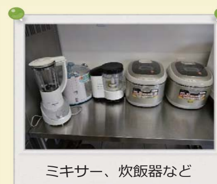
ミキサー、炊飯器など