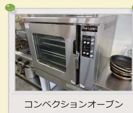
コンベクションオーブン