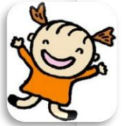
戸田市キャラクター「トコちゃん」