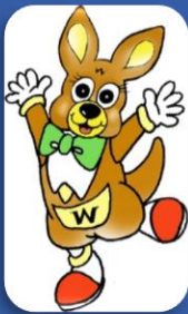
蕨市マスコット「ワラビー」